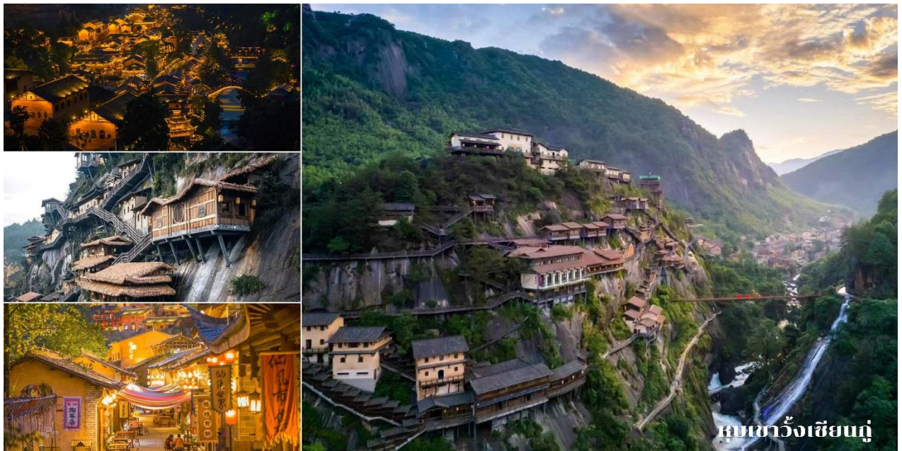
หุบเขาวังเซียนกุ

นำท่านชม ทิวทัศน์ยามค่ำคินหุบเขาวังเซียนกุ ซึ่งเรียกว่าเป็นจุดไฮไลท์หลักของเมืองแห่งนี้ เมื่อถึงเวลา ค่ำคินทั้งเมืองจะเปิดไฟทั่วทั้งเมือง แสงไฟวิบวับ บรรยากาศสุดเจ๋งตั้งเมืองสวรรค์ในแดนดิน