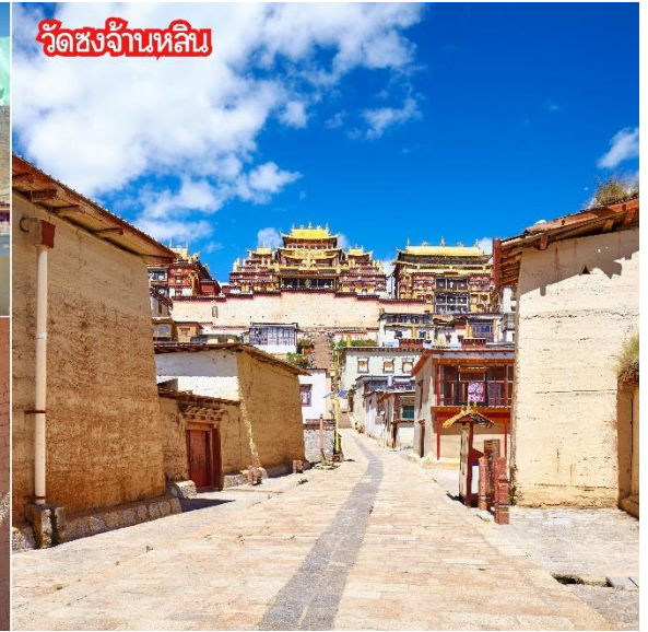
วัดซงจ้านหลิน

นำท่านชม วัดลามะ หรือ วัดซงจ้านหลิน สร้างขึ้นในสมัยราชวงศ์ชิง มีพระลามะจำพรรษาอยู่มากกว่า 700 รูป วัดแห่งนี้ห่างจากเมืองจางเตี้ยนไปทางเหนือประมาณ 5 กิโลเมตร มีการสร้างในลักษณะจำลองแบบจากพระราชวังโปตาลา (Potala) ในกรุงลาซา (Lhasa) และนอกจากนี้ยังเป็นวัดนิกายลามะแบบทิเบตที่ใหญ่ที่สุดในมณฑลยูนนานซึ่งมี อายุที่เก่าแก่กว่า 300ปี และในช่วงเทศกาล ชาวทิเบตส่วนใหญ่ ก็จะนิยมการเดินระบำหน้ากากและเป่าแตรงอนซึ่งเป็นการละเล่นที่อยู่ในช่วง เทศกาล สำคัญต่างๆของวัด รวมถึงประเพณีต่างๆ ที่ชาวทิเบตได้อนุรักษ์ไว้ ณ วัดซงชานหลินแห่งนี้