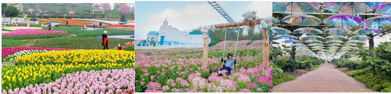
ชากระ ดอกทิวลิป

หมายเหตุ: ทางสวนดอกไม้มีการปรับเปลี่ยนชนิดของดอกไม้ไปตามฤดูกาล กรณีสวนดอกไม้ปิด ไม่พร้อมให้บริการ หรือเกิดเหตุสุดวิสัยที่ไม่สามารถควบคุมได้ ขอสงวนสิทธิ์เปลี่ยนรายการทัวร์ไปร้านหนังสือจตุจักรหรือสถานที่อื่น โดยไม่ได้แจ้งให้ทราบล่วงหน้า