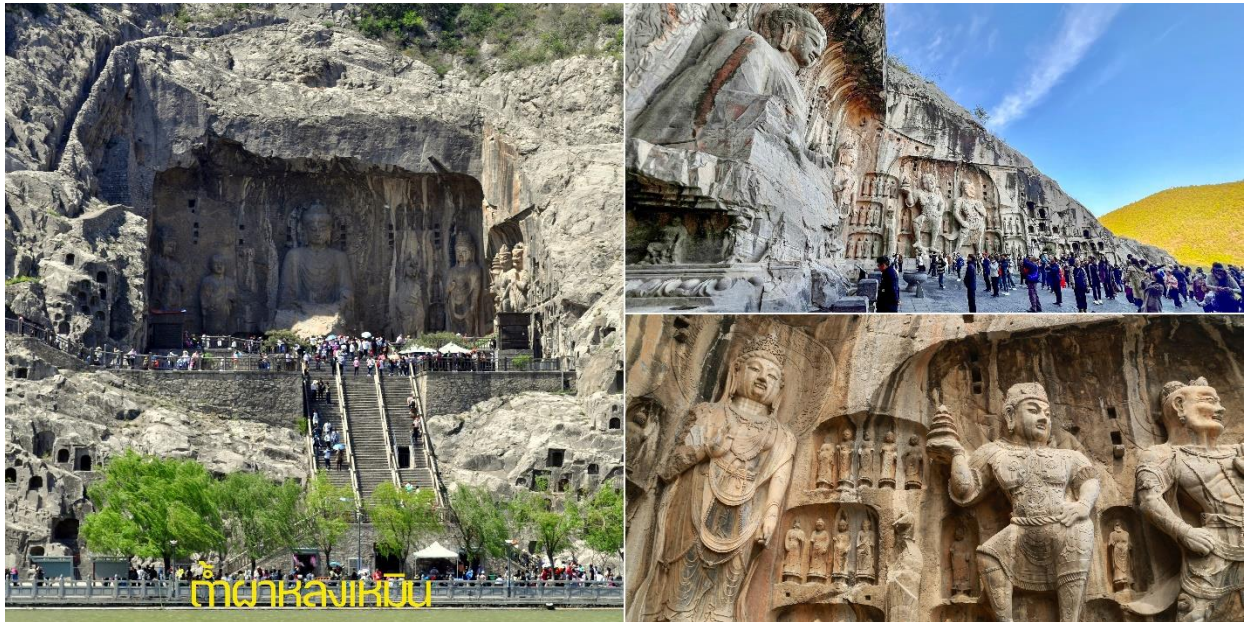
ถ้ำผาหลงเหมิน

พุทธแห่งนี้ที่ได้รับอิทธิพลมาจากอินเดีย และเอเชียกลาง มีอายุราว 1,500 ปี สร้างเมื่อ ราวปี ค.ศ. 494 ในสมัยเว่ยเหนือ และสร้างเพิ่มเติมเรื่อยมาจนถึงสมัยราชวงศ์ถัง ใช้ระยะเวลาในการก่อสร้างบูรณะต่อเติมยาวนานถึง 400 กว่า ปีปัจจุบันยังคงหลงเหลือถ้ำผาแกะสลักอยู่จำนวน 2,100 กว่าคูหา โพรงแท่นบูชา 2,345 ช่อง ศิลาคาริกสลักอักษรจีน และหมายเหตุบันทึกต่างๆ อีก 3,600 กว่าหลัก รวมถึงเจดีย์พุทธ 50 กว่าแห่ง พระพุทธรูปสลักมากกว่า 100,000 องค์ใหญ่สูงสุด 17 เมตร องค์เล็กสุดเพียงแค่ 2 เซนติเมตร