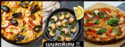
PAELLA ข้าวผัดสเปน / หอยแอสคาโก้ / พิชชามาการ์ต้า