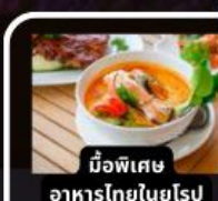
มือพิเศษ อาหารไทยในยุโรป