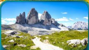
Tre Cime di Lavaredo