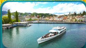
ล่องเรือทะเลสาบลูซิิร์น