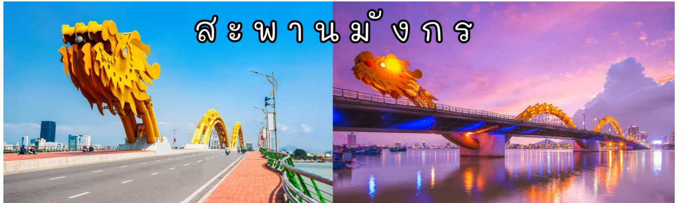
สะพานมังกร

เย็น 🍽️ รับประทานอาหารค่ำ ณ ภัตตาคาร (เผื่อไก่ อาหารเวียดนาม) ได้เวลาอันสมควรเดินทางต่อไปยัง สะพานมังกร(Dragon Bridge) อีกหนึ่งสัญลักษณ์ที่เกี่ยวเนื่องเมืองดานังที่มีความยาว 666 เมตร ความกว้างเท่าถนน 6 เลนส์ เชื่อมต่อสองฟากฝั่งของแม่น้ำฮัน ประเทศเวียดนามสะพานมังกรถูกสร้างขึ้นเพื่อเป็นแหล่งท่องเที่ยวดานัง เป็นสัญลักษณ์ของการฟื้นคืนประเทศและเป็นการฟื้นฟูเศรษฐกิจของประเทศ โดยได้เปิดใช้งานตั้งแต่ปี 2013 ด้วยสถาปัตยกรรมที่บวกกับเทคโนโลยีสมัยใหม่ ที่ได้รับแรงบันดาลใจจากตำนานของเวียดนามเมื่อกว่าหนึ่งพันปีมาแล้ว