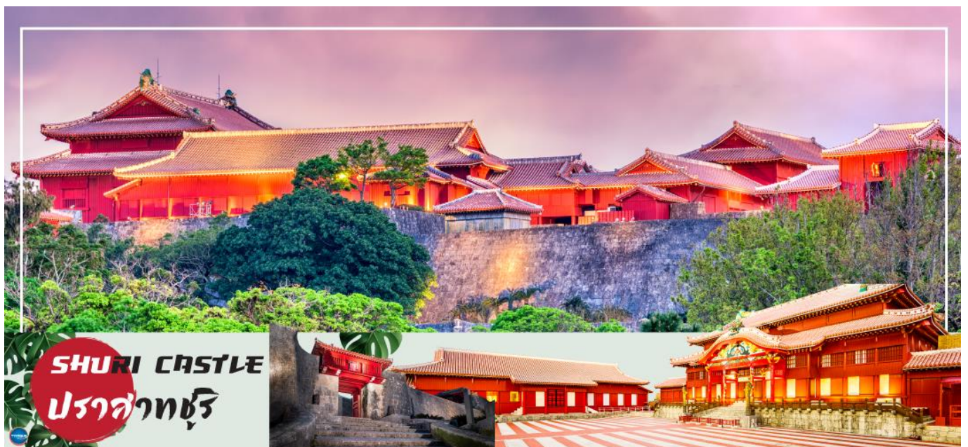
SHURI CASTLE ปราสาทชูริ

ปราสาทชูริ (ด่านนอก) – ดิวตี้ฟรี – โอกินาว่าเวิลด์ – ถ้ำธารมรดกเกียวคุเซ็นโด – โรงงานแก้ว – ศูนย์การค้าอุมิเดจิจิ เทอเรส