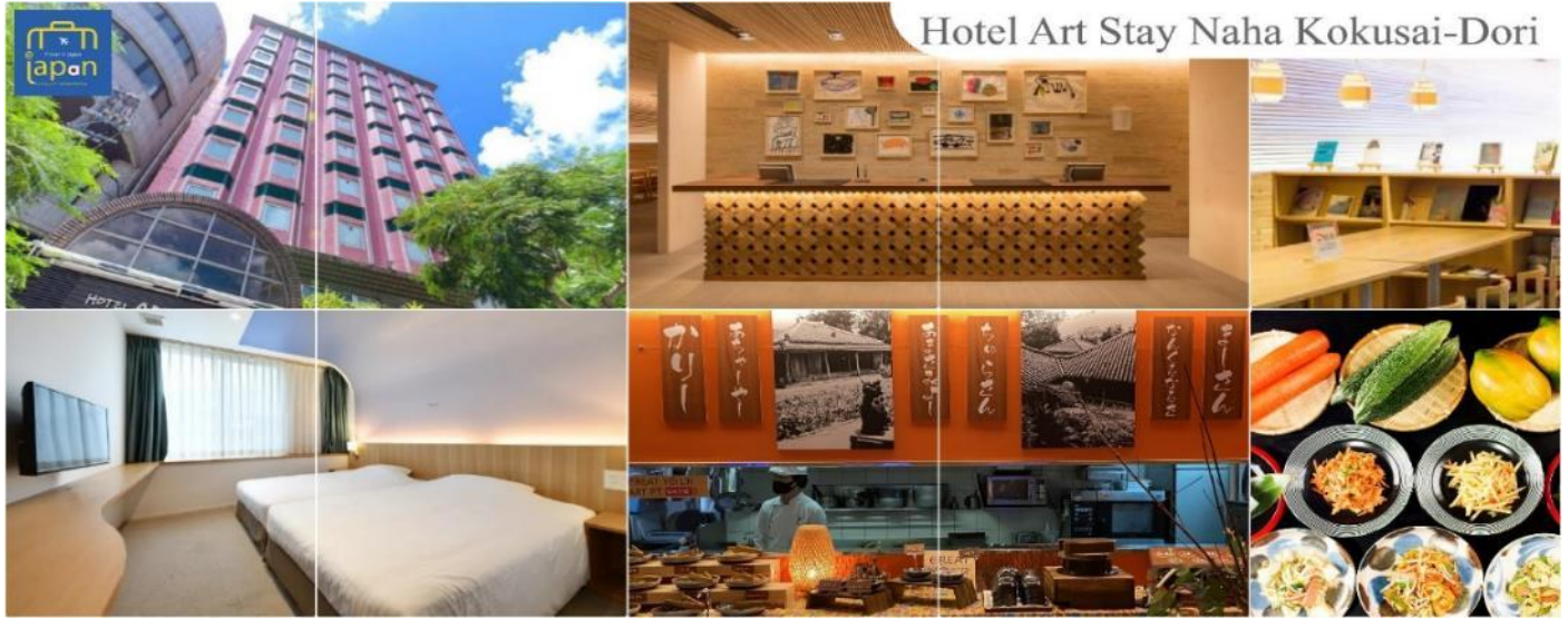
Hotel Art Stay Naha Kokusai-Dori

HOTEL ART STAY NAHA KOKUSAI-DORI หรือเทียบเท่า