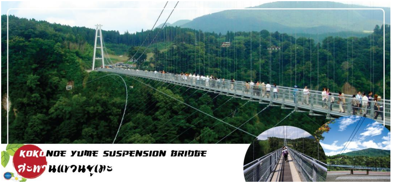
KOKONOE YUME SUSPENSION BRIDGE สะพานแขวนยูเมะ

วันที่สาม เมืองเบปปุ – สะพานแขวนยูเมะ – เมืองคามาโมโตะ – ปราสาทคามาโมโตะ (เข้าชม) – ย่านช้อปปิ้งซากุระโนะบาระ โจโซเอน – คุมะมงสแควร์ – เมืองฟุกุโอกะ – ดิวตี้ฟรี – กันดั้ม ปาร์ค ฟุกุโอกะ