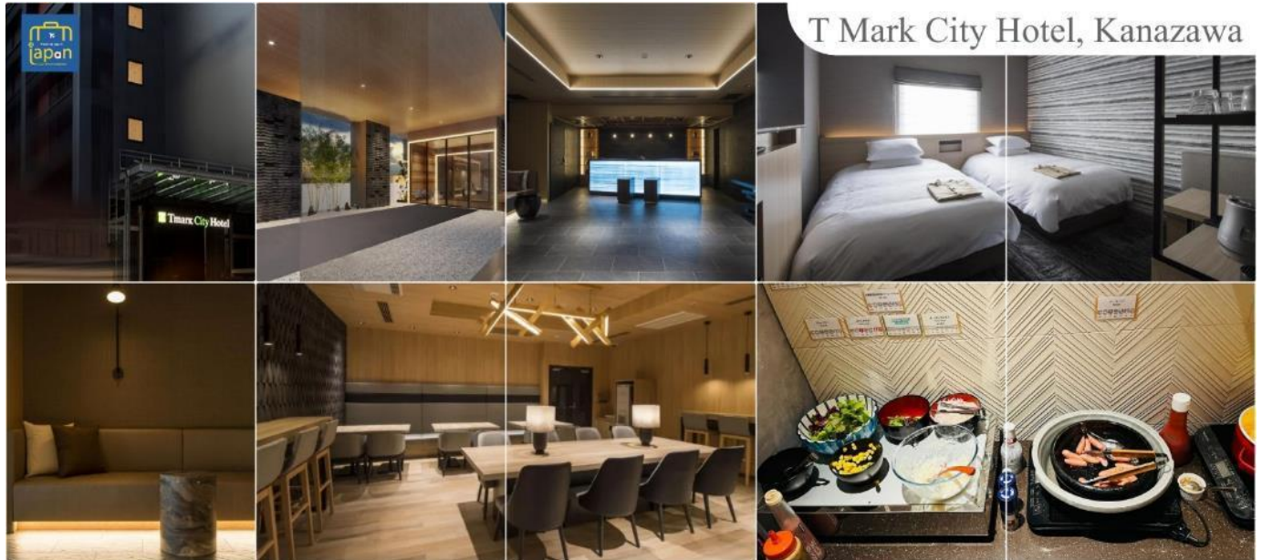
T Mark City Hotel, Kanazawa

เย็น รับประทานอาหารเย็นอิสระตามอัธยาศัย พักที่ T MARK CITY HOTEL, KANAZAWA หรือเทียบเท่าระดับเดียวกัน