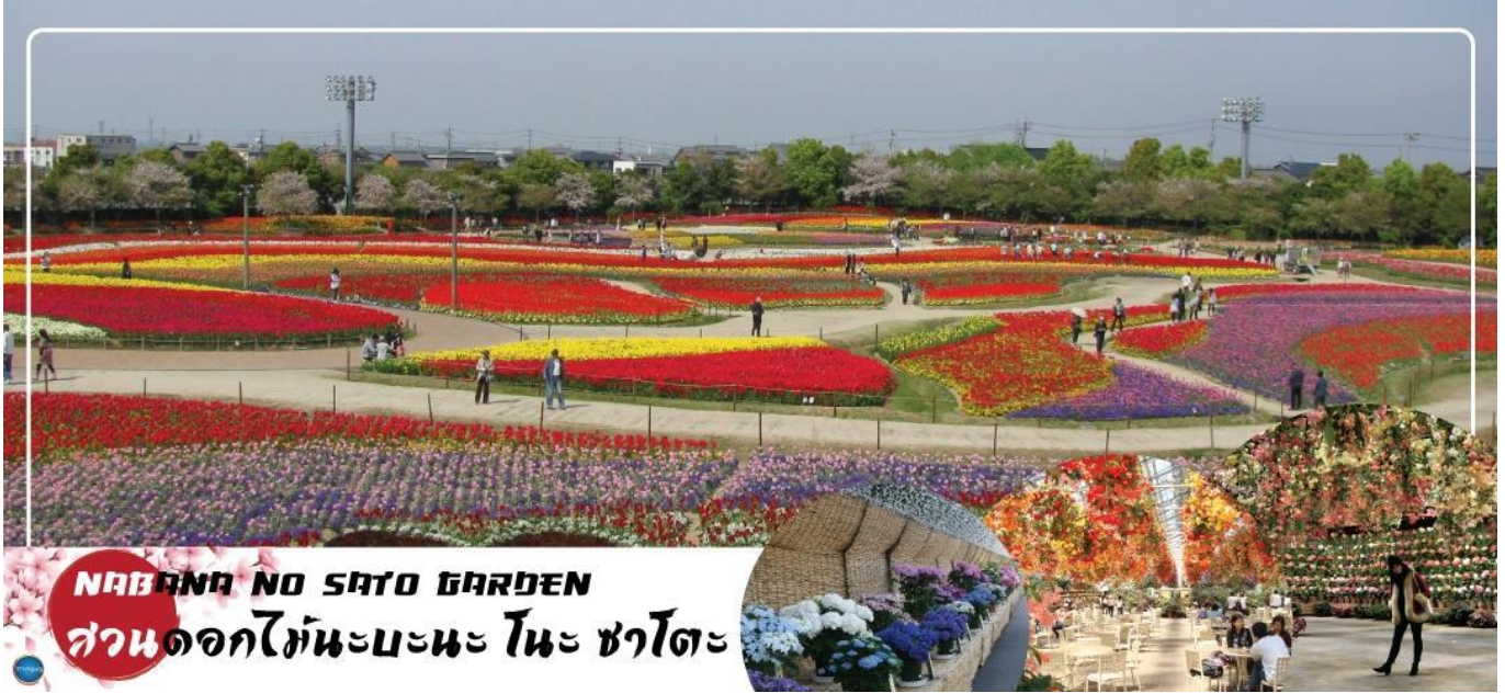
NABANA NO SATO GARDEN สวนดอกไม้ทะเละบะนะ โนะ ซาโตะ

00.45 น. เห็นฟ้าสู่ เมืองนาโกย่า ประเทศญี่ปุ่น โดยเที่ยวบินที่ XJ638