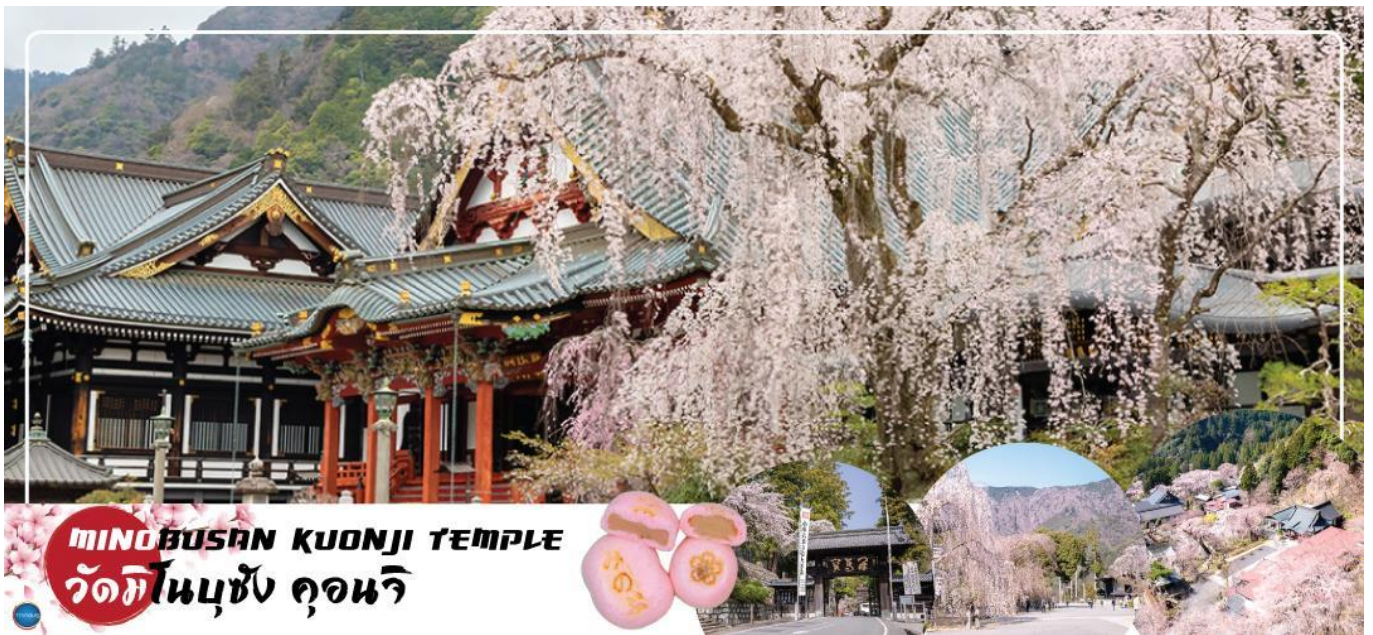
MINOBUSAN KUONJI TEMPLE วัดมิโนบุซัง คุอนจิ

วันที่ห้า เมืองยามานาชิ – วัดมิโนบุซังคุอนจิ(จุดชมซากุระขึ้นกับภูมิลูกฟ้า) – กระเช้าไฟฟ้ามิโนบุซัง – จังหวัดชิซุโอกะ – นิสงไดระ ยูเมะ เทอร์เรซ – เมืองนาโกย่า – ย่านซาคาเอะ