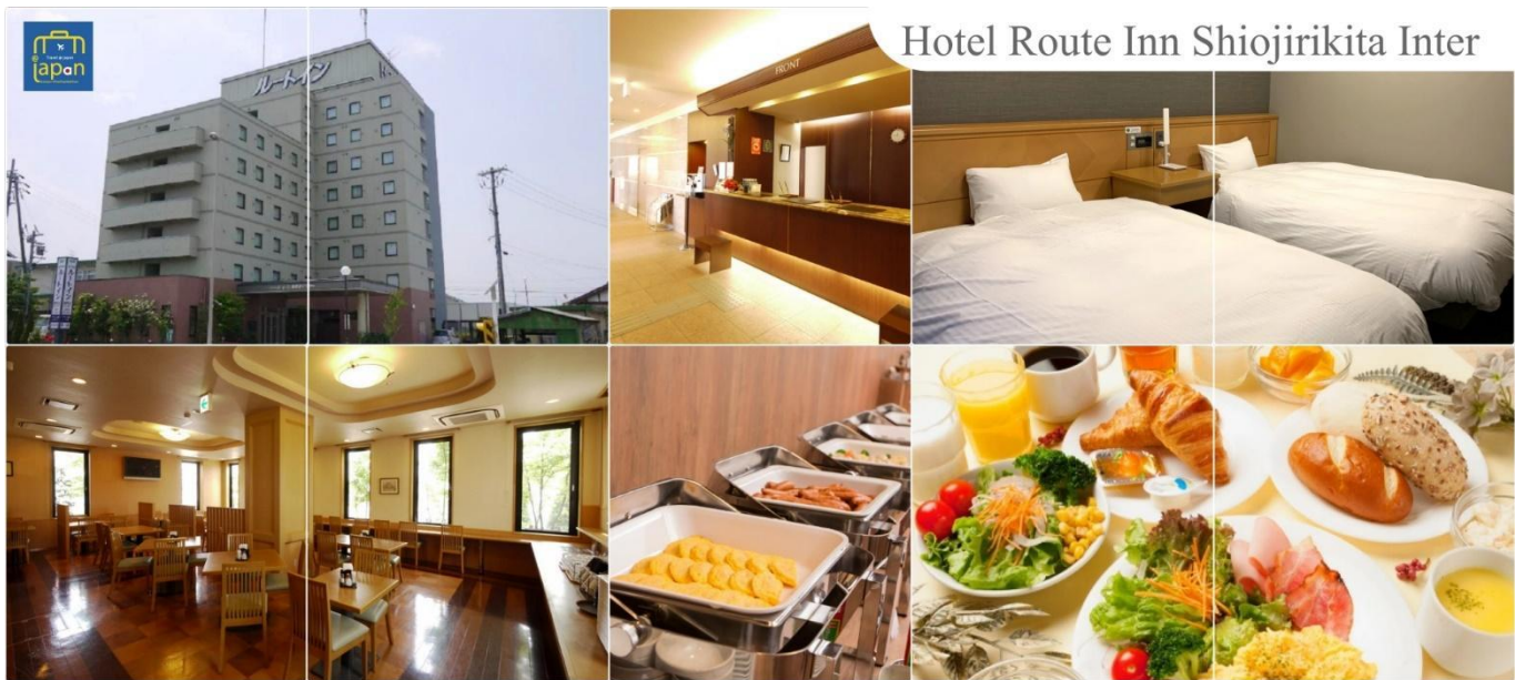
Hotel Route Inn Shiojirikita Inter

พักที่ HOTEL ROUTE-INN SHIOJIRIKITA INTER, MATSUMOTOหรือเทียบเท่าระดับเดียวกัน