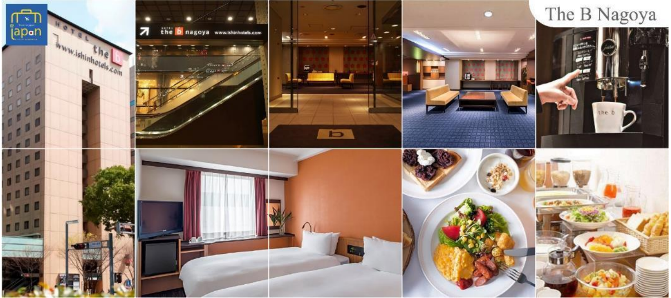
The B Nagoya