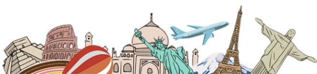
Yukari No Mori Fujikawaguchiko