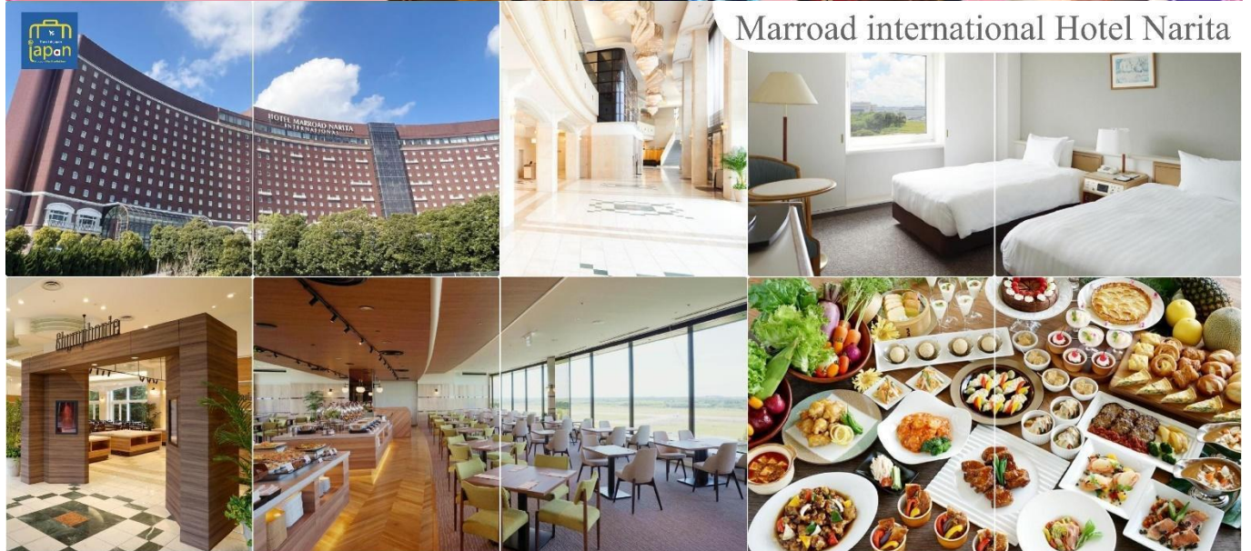
Marroad international Hotel Narita