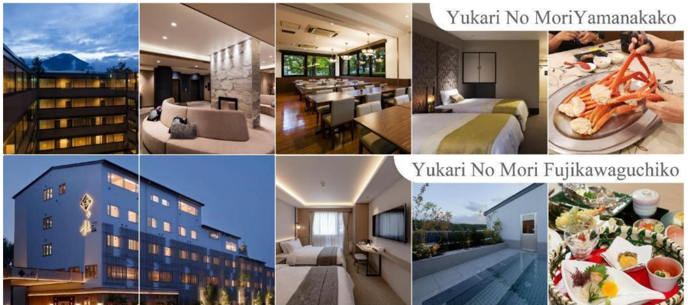
Yukari No Mori Yamanakako