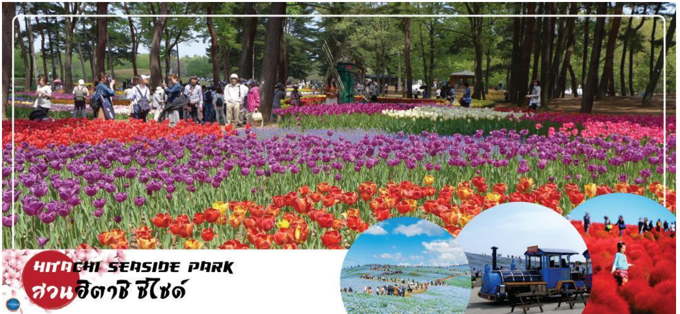
HITACHI SEASIDE PARK สวนฮิตาชิ ซีไซด์

02.25 น. เหนือฟ้าสู่ เมืองนาริตะ ประเทศญี่ปุ่น โดยเที่ยวบินที่ XJ602