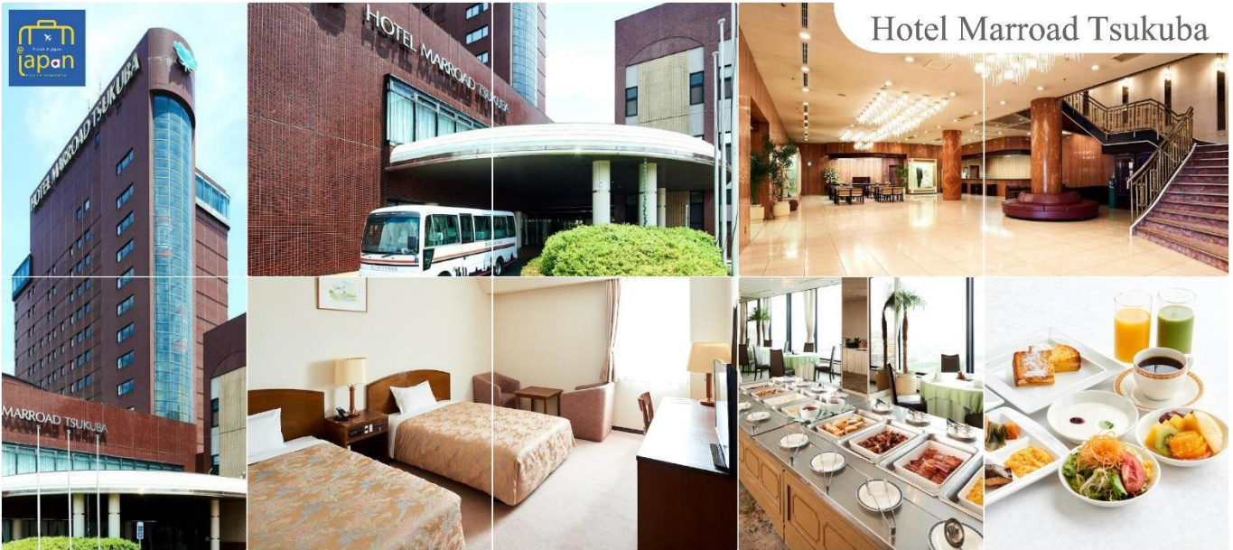
Hotel Marroad Tsukuba

HOTEL MARROAD, TSUKUBA หรือระดับเดียวกัน