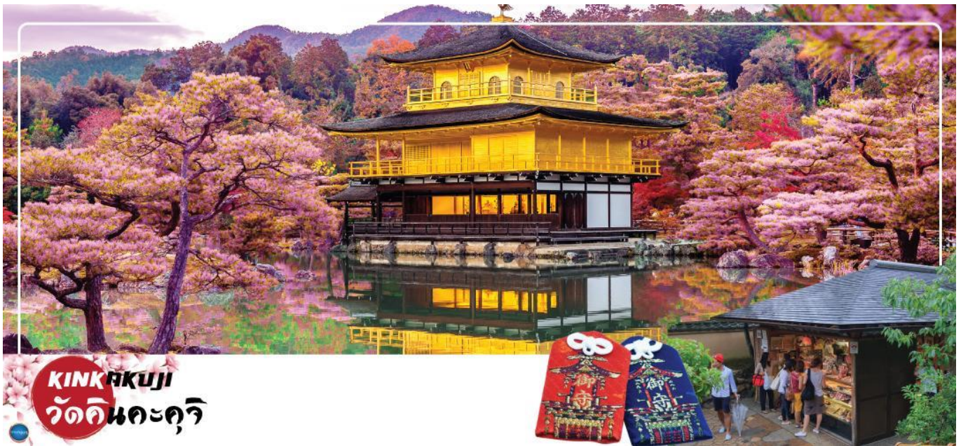
KINKAKUJI วัดคินคะคุจิ

จากนั้นนำท่านสู่ วัดคินคะคุจิ (Kinkakuji) (ใช้เวลาเดินทางประมาณ 30 นาที) หรือ วัดทอง หรือ วัดอิคคิวซัง ที่คนไทยนิยมเรียก เดิมสร้างขึ้นเพื่อใช้เป็นบ้านพักของท่านโชกุนอาชิกากะ โยชิมิสึและท่านมีความตั้งใจยกบ้านพักแห่งนี้ให้เป็นวัดนิกายเซนภายหลังจากที่ท่านเสียชีวิต คนไทยนิยมเรียกกันว่า วัดทอง