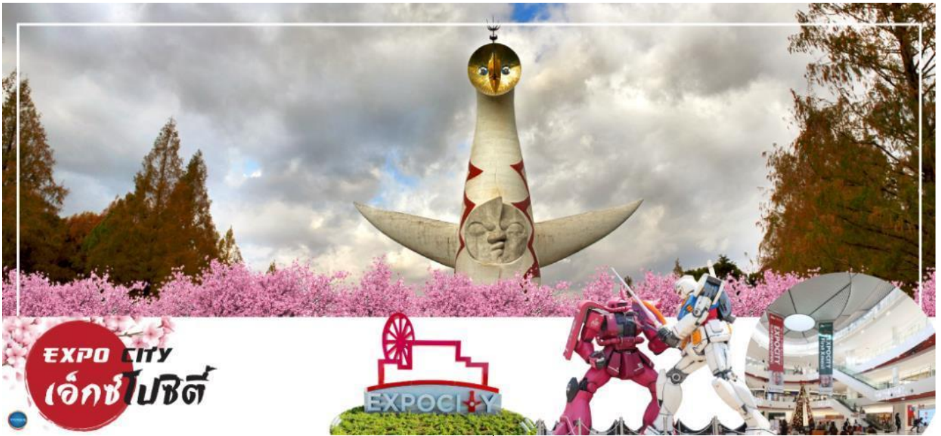
อควาเรียม สวนดอกไม้บานา และพิพิธภัณฑ์ที่น่าสนใจ

บริเวณใกล้กันมี สวนสาธารณะ Expo '70 Commemorative Park (ไม่รวมค่าเข้าชม) ครอบงำแห่งสวนสาธารณะที่ใหญ่ที่สุดของโอซาก้า รวมถึงเป็นจุดชมซากุระที่สวยงาม รวมถึง Tower of the sun ที่เป็นแลนด์มาร์ก ที่สำคัญบริเวณรายรอบนั้นยังเต็มไปด้วยสิ่งที่น่าสนใจไม่ว่าจะเป็น