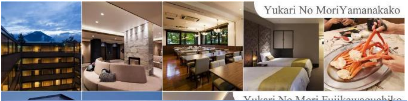
Yukari No Mori Yamanakako