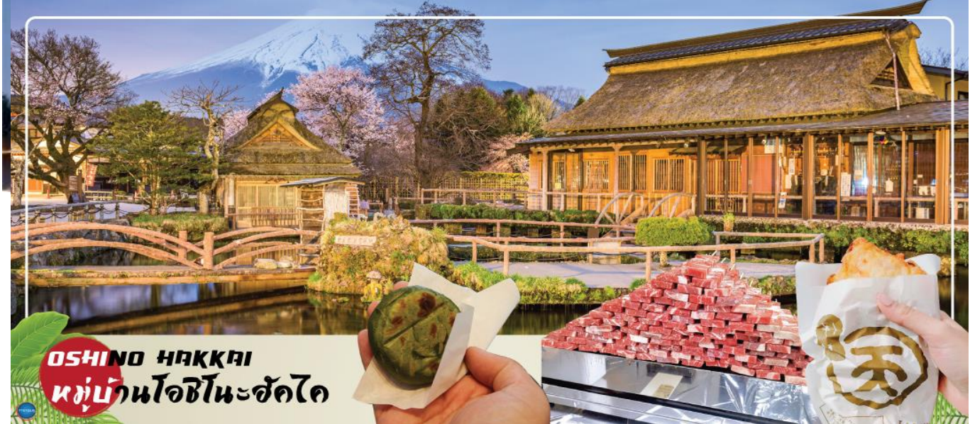
OSHINO HAKKAI หมู่บ้านโอชิโนะฮัคไค