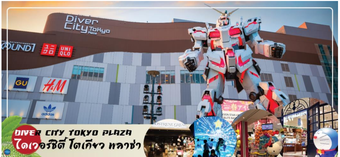
DIVER CITY TOKYO PLAZA ไดเวอร์ซิตี โตเกียว พลาซ่า

ห้างหนึ่ง ที่อยู่บนเกาะ โอไดบะ จุดเด่นของห้างนี้ก็คือ หุ่นยนต์กันดั้ม ขนาดเท่าของจริง ซึ่งมีขนาดใหญ่มาก ในบริเวณห้าง อีกระชอปิ้งตามอัธยาศัย ได้เวลาอันสมควรนำท่านเดินทางสู่ เมืองนาริตะ (Narita) (ใช้เวลาเดินทางประมาณ 1 ชั่วโมง)