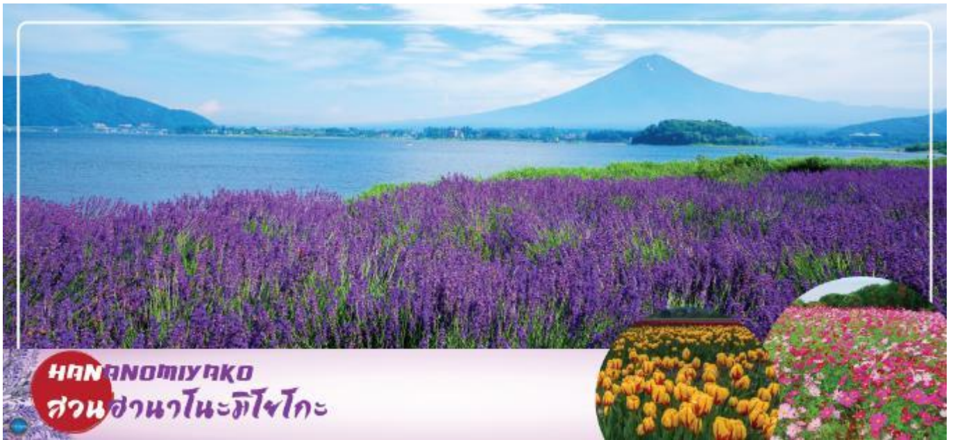
HANANOMIYAKO สวนसानะโนะมิยาโกะ

ท่าอากาศยานนานาชาตินาริตะ – เมืองยามานาชิ – สวนดอกไม้सानะโนะมียาโกะ หรือ เทศกาลชมดอกลาเวนเดอร์ที่ทะเลสาบคาวากุจิ (ตามฤดูกาล) หรือ Rainbow Flower Festival 2025 – หมู่บ้านโอชิโนะฮักไก – ออนเซ็น + ชาบูยักษ์