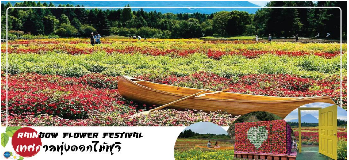
RAINBOW FLOWER FESTIVAL เทศกาลทุ่งดอกไม้ฟูจิ

หรือ ชม Rainbow Flower Festival 2025 (ปกติเทศกาลจะจัดช่วง ปลายเดือนสิงหาคม - ต้นเดือนตุลาคม ซึ่งกำหนดการปีนี้อาจยังไม่มีประกาศอย่างเป็นทางการ) สถานที่จัดงานบริเวณคาวากุจิโกะ เมืองแห่งภูเขาไฟฟูจิ เทศกาลดอกไม้เมืองร้อนที่มีชื่อเสียงของญี่ปุ่น ที่มีเพียงปีละครั้งเท่านั้น ภายในเทศกาลมีการจัดแสดงดอกไม้เมืองร้อนหลากหลายกว่า 10 ชนิด ไม่ว่าจะเป็น ดอกมิโกเนีย, ดอกซินเนีย, ดอกซัลเวีย และดอกรัตเบเกีย นอกจากนี้ยังสามารถมองเห็นวิวของภูเขาไฟฟูจิได้อีกด้วย ภายในสวนมีจุดให้ถ่ายรูปมากมาย และยังมีสวนดอกไม้สไตล์อังกฤษที่มาพร้อมตัวละครมาสคอตสุดน่ารัก "Piter Rabbit English Gardent" และนอกจากนี้ยังมีคาเฟ่ไว้นั่งพักผ่อนชมวิวแบบชิลๆอีกด้วย