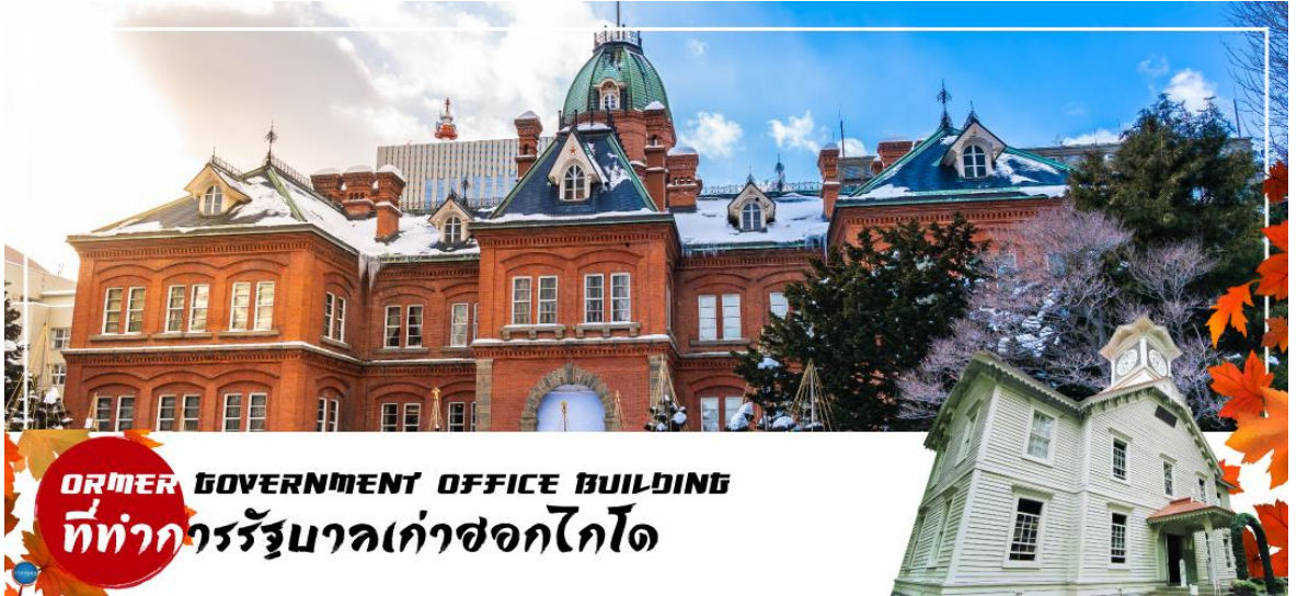
FORMER GOVERNMENT OFFICE BUILDING ที่ทำการรัฐบาลเก่าซอกไกโด

จากนั้น ผ่านชม หอนาฬิกาเมืองซัปโปโร ( Sapporo Clock Tower หรือภาษาญี่ปุ่นเรียกว่า Sapporo Tokeidai ) เป็นหอนาฬิกาโบราณมีลักษณะเป็นอาคารไม้ที่มีหลังคาสีแดงและผนังสีขาว ถูกออกแบบและบริจาคให้โดยรัฐบาลสหรัฐอเมริกา ในปี ค.ศ. 1878 เป็นสัญลักษณ์ทางวัฒนธรรม และประวัติศาสตร์ของเมืองซัปโปโร สำหรับตัวนาฬิกาถูกติดตั้งในปี ค.ศ. 1881 จากบริษัท E. Howard & Co. เมือง Boston และในปี ค.ศ. 1970 หอนาฬิกาแห่งนี้ถูกกำหนดให้เป็นทรัพย์สินทางวัฒนธรรมที่สำคัญแห่งชาติ อีกด้วย