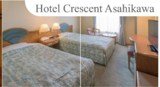
Hotel Crescent Asahikawa