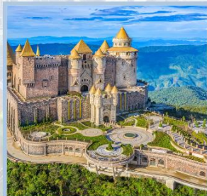
ปราสาทจันทร์