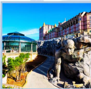
โซน Eclipse Square