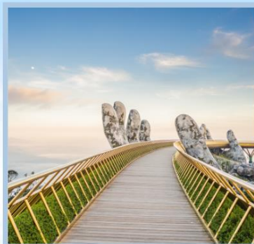
สะพานมือทองคำ