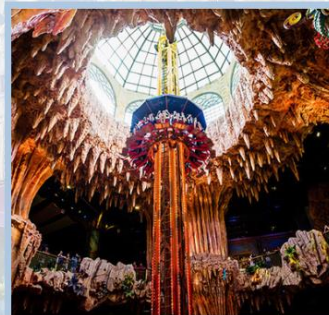
สวนสนุก Fantasy Park