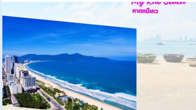
My Khe Beach หาดหมีเคว

พาชมหาดหมีเคว (My Khe Beach) ชายหาดที่สวยงามที่สุดในเมืองดานัง มีแนวโค้งตามลักษณะภูมิประเทศของเวียดนามซึ่งยาวกว่า 32 กิโลเมตร มีหาดทรายสีขาวและเม็ดทรายละเอียด น้ำทะเลสีฟ้าใส ท่านจะได้เพลิดเพลินไปกับธรรมชาติที่สวยงามทั้งวิวภูเขาและอ่าวที่อยู่ตรงข้าม อิสระถ่ายรูปเช็किनตามอัธยาศัย