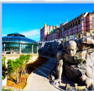
โซลิว Eclipse Square