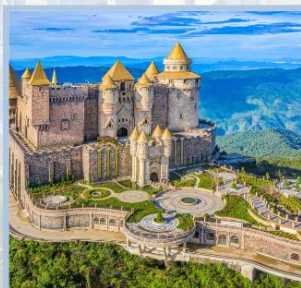
ปราสาทจันตรา