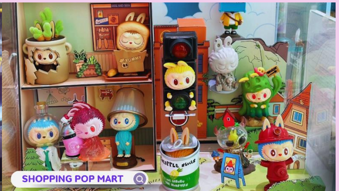
SHOPPING POP MART