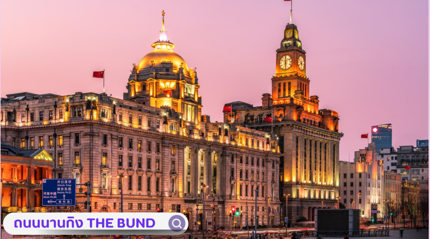
ถนนนานกิง THE BUND