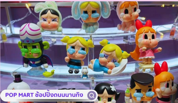
POP MART ช้อปปิงถนนนานกิง

นำท่านถ่ายรูป ตึกเซี่ยงไฮ้ ทาวเวอร์ (Shanghai Tower) เป็นอาคารสูงที่ตั้งอยู่ในเขตภูมิศาสตร์เศรษฐกิจและการเงินของเซี่ยงไฮ้ ประเทศจีน ซึ่งเป็นอาคารสูงที่สูงที่สุดในประเทศจีนและอันดับสองของโลก หลังจากอาคารบูรณาการบูรณที่สูงที่สุดในโตเกียว ตลอดจนเป็นที่รู้จักกันดีในทุกส่วนของโลกสูงเป็น 632 เมตร (2,073 ฟุต) และมีจำนวนชั้นทั้งหมด 128 ชั้นไม่ขึ้นตึก นำท่านเดินทางสู่ NORTH BUND GREEN LAND สวนสาธารณะสุดปังริมน้ำ ที่มุมถ่ายรูปจึ้งมาก พื้นที่สีเขียวริมแม่น้ำฝั่งเหนือของ The Bund ท่านจะได้เห็นวิวของหอไข่มุกที่ศตวรรษออก เป็นแนวคิดที่ทำให้เมืองมหานครที่ทันสมัย และยิ่งใหญ่อย่างเซี่ยงไฮ้ให้ดูมีสีสันสบายตาผสมผสานกับธรรมชาติได้อย่างลงตัว ทำให้แลนด์มาร์คแห่งนี้กลายเป็นจุดเช็คอินที่ทั้งคนพื้นที่ และนักท่องเที่ยวต่างพากันมาถ่ายรูปอย่างไม่ขาดสาย นำท่านสู่บริเวณ หาดไวทาน (WAITAN) ซึ่งไม่ได้เป็นหาดทรายชายทะเลแต่อย่างใด แต่เป็นย่านถนนริมน้ำที่มีความยาว 1.5 กิโลเมตร ไปตามริมน้ำหวงผู่ฝั่งตะวันตกซึ่งอยู่ในย่านเมืองเก่า หาดไวทานยังเคยเป็นสถานที่ถ่ายทำภาพยนตร์ที่โด่งดังเรื่อง “เจ้าพ่อเซี่ยงไฮ้”