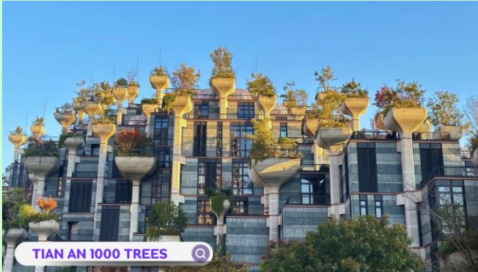
TIAN AN 1000 TREES