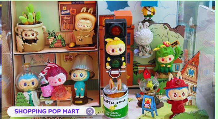
SHOPPING POP MART