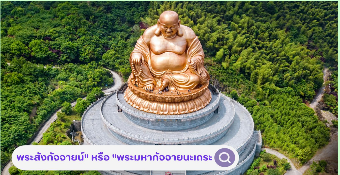
พระสังกัจจายน์" หรือ "พระมหากัจจายนะเถระ" 🔍

นำท่านชม วัดเสวียโต้วซาน ตั้งอยู่ในเมืองหนิงโป มณฑลฝูเจี้ยน ตั้งอยู่ที่เชิงเขาเซวาทัว (Xuedou Mountain) วัดนี้มีชื่อเสียงในฐานะสถานที่ศักดิ์สิทธิ์สำหรับการศึกษาพุทธศาสนา การและสถานที่ฝึกฝนและปฏิบัติธรรมตามหลักของพระศรีอารยเมตไตรย ซึ่งเป็นพระโพธิสัตว์ที่สำคัญในศาสนาพุทธ ที่วัดมีพระพุทธรูปขนาดใหญ่ที่ตั้งอยู่กลางแจ้ง พระสังกัจจายน์" หรือ "พระมหากัจจายนะเถระ" ขนาด 33 เมตร เมตร มีลักษณะที่งดงามและประณีต พระพุทธรูปนี้สร้างขึ้นด้วยวัสดุที่ทนทานและมีความสวยงามทางศิลปะ เป็นพระโพธิสัตว์ที่สำคัญในศาสนาพุทธ พระองค์เป็นสัญลักษณ์ของความเมตตาและการกรุณา และถูกเคารพสักการะว่าเป็นพระโพธิสัตว์ รอที่จะมาตรัสรู้เป็นพระพุทธเจ้าองค์ถัดไปเมื่อสิ้นพุทธกาลของสมเด็จพระสัมมาสัมพุทธเจ้า นอกจากนี้ยังมีสถานที่อื่น ๆ ในวัดที่น่าสนใจ เช่น หอพระธรรม พิพิธภัณฑ์ และสวนและทางเดินที่สวยงาม