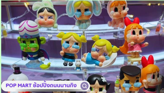
POP MART ซ้อปปักถนนนนทบุรี