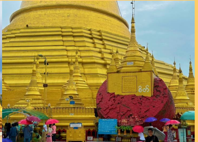
นำคณะเดินทางสู่ เมืองไจ้กั๊ทโย (Kyaikhtyo) ใช้เวลาเดินทางประมาณ 2-3 ชั่วโมง